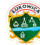
Ilość odebranych odpadów z terenu gminy Łukowica w 2025 roku [w: Mg]